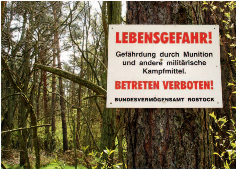
An Land eine Selbstverständlichkeit: Sperrgebiete auf Grund alter Munition.

Meeresboden bei Helgoland jedoch nicht sehr wahrscheinlich. Schwachpunkt einer jeden Tabun-Granate ist aber das seitliche Füllloch mit seiner Verschlusschraube. Schon bei neu produzierten Granaten kam es hier häufiger zu direkten Leckagen. Aggressives Meerwasser verstärkt dieses Problem. Die Granaten könnten also heute größtenteils undicht sein. Da die Granaten beim Versenken an der Wasseroberfläche keinen Überdruck, in ihrem Hohlraum aber eine kleine Luftblase besaßen, bewirkt der fünfmal erhöhte Umgebungsdruck in 50 Metern Wassertiefe, dass eher Salzwasser in die Granate eindringt als dass Tabun herausläuft. Erst bei einer größeren Durchrostung oder durch nachlassenden Außendruck bei einer Bergung wäre eine schnellere Freisetzung des Tabuns zu erwarten.