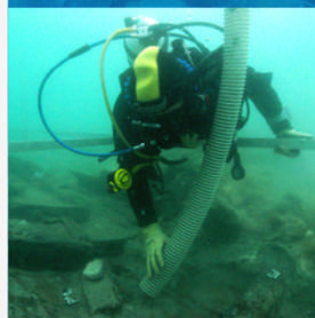
FUWA-Mitglied im Einsatz.

In jeweils mehrwöchigen Ausgrabungskampagnen werden durch den FUWA e.V. hunderte Taucheinsätze durchgeführt sowie technisches Equipment und Logistikleistungen zur Verfügung gestellt.